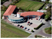
Fletcher Duinhotel Burgh Haamstede **** (Burgh Haamstede)

Bei der Auswahl der Unterkunft versuchen wir so weit wie möglich einen sicheren und geschlossenen Fahrradschuppen zu berücksichtigen. Allerdings können wir dies nicht bei allen Unterkünften garantieren und dies hängt teilweise von der Anzahl der Fahrräder anderer Gäste ab.