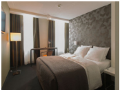
Hotel Mauritz *** (Willemstad)