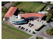
Fletcher Duinhotel Burgh Haamstede **** (Burgh Haamstede)

Bei der Auswahl der Unterkunft versuchen wir so weit wie möglich einen sicheren und geschlossenen Fahrradschuppen zu berücksichtigen. Allerdings können wir dies nicht bei allen Unterkünften garantieren und dies hängt teilweise von der Anzahl der Fahrräder anderer Gäste ab.