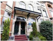
Hotel Fidder *** (Zwolle)