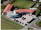
Fletcher Duinhotel Burgh Haamstede **** (Burgh Haamstede)

Bei der Auswahl der Unterkunft versuchen wir so weit wie möglich einen sicheren und geschlossenen Fahrradschuppen zu berücksichtigen. Allerdings können wir dies nicht bei allen Unterkünften garantieren und dies hängt teilweise von der Anzahl der Fahrräder anderer Gäste ab.