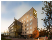
Best Western Zaan Inn *** (Zaandam)